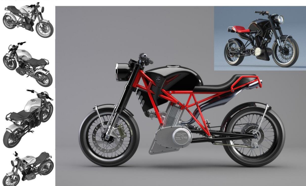
Widoki perspektywiczne kompletnego motocykla